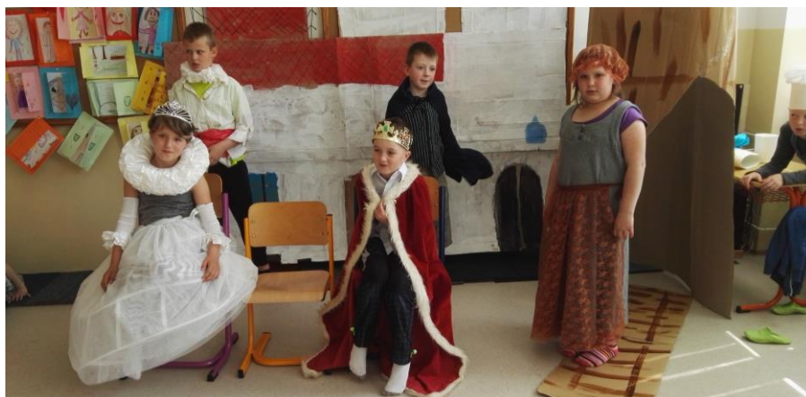
Žáci 2. B při zájmovém kroužku nacvičili Šípkovou Růženku

Problém byl předán OSPOD. Žádné další případy rizikového chování se nevyskytly.