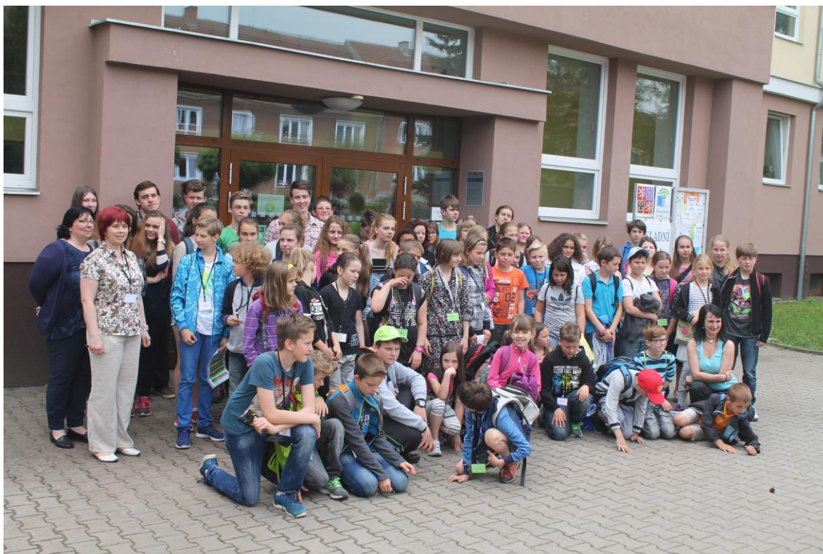
Společné setkání ekotýmů a žákovských parlamentů před milínskou školou