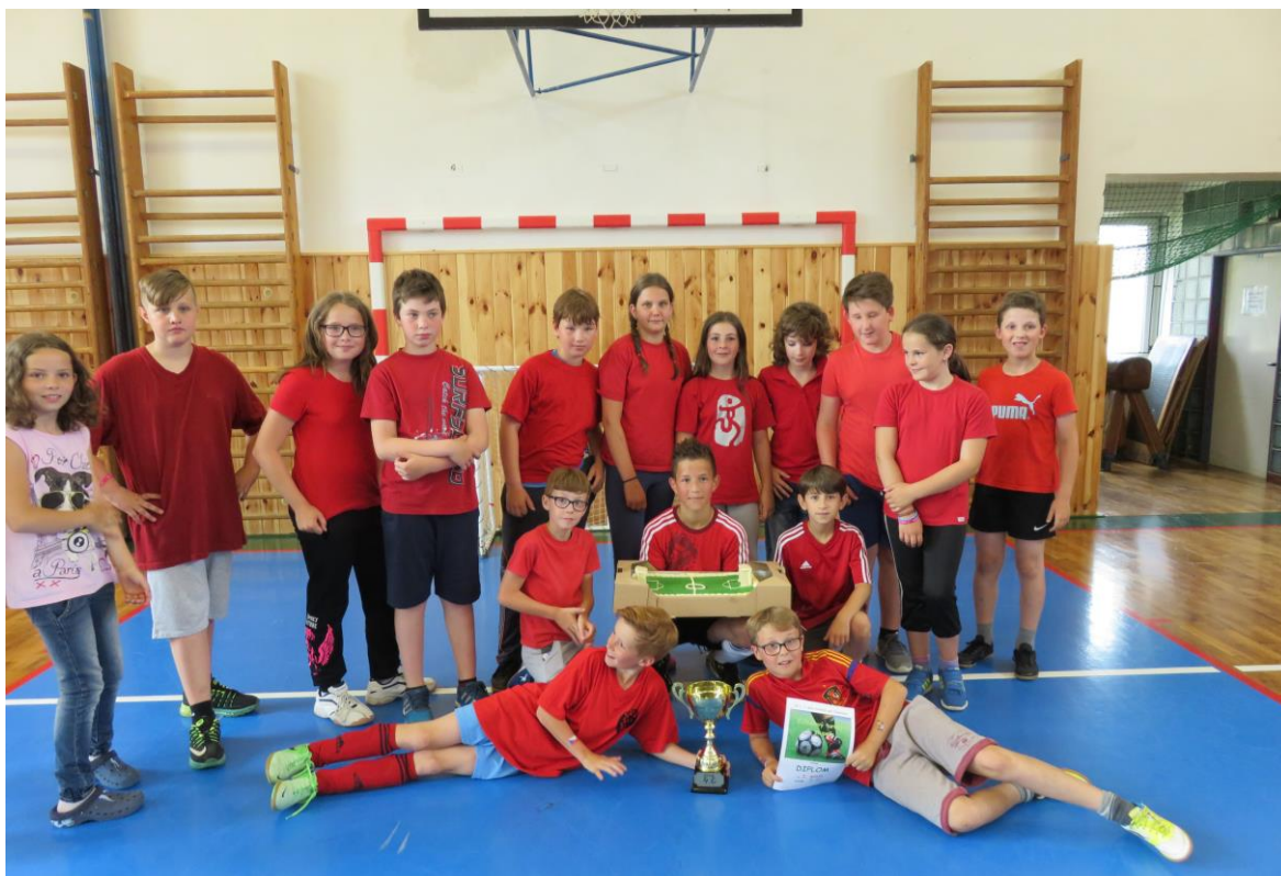
Vítězné družstvo 4. C fotbalového turnaje I. stupně

Následující den se hrál turnaj II. stupně. Nakonec se z vítězství radovali žáci 9. B.