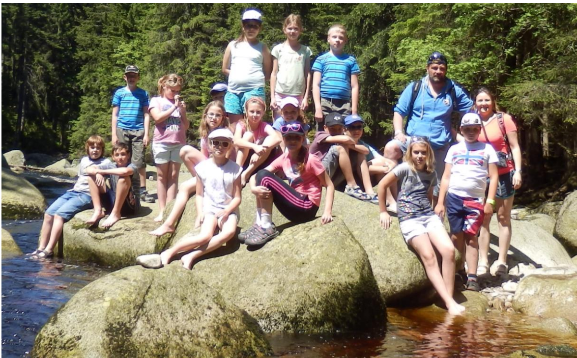
Žáci 4. A na břehu Vydry