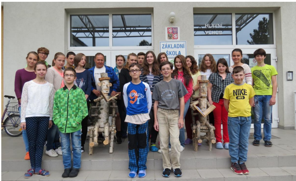
Členové žákovského parlamentu s novými spolužáky – čtenáři Alfrédem a Matyldou

Po celý školní rok pracoval ve škole žákovský parlament. Je složen ze zástupců tříd 5. – 9. ročníku. Spolupracuje s vedením školy. Pro své spolužáky pořádá řadu akcí. K nejzdařilejším patřily lampionový pochod, Mikulášská nadílka, karneval pro žáky 1. stupně a školní družiny a zábavné odpoledne v družině.