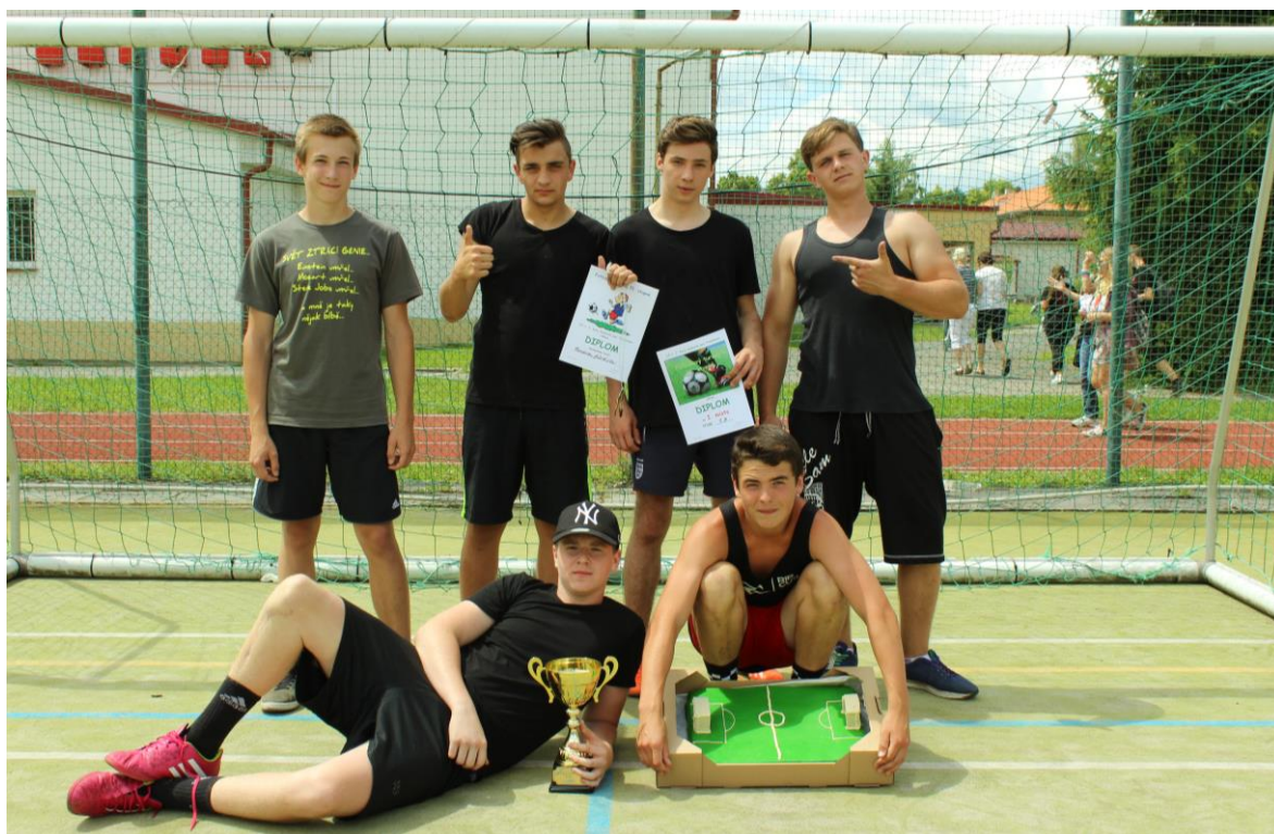
Vítězné družstvo 9. B fotbalového turnaje II. stupně