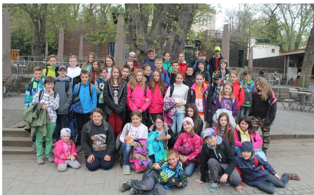
Ekotým v ZOO Praha

vedení školy a správních zaměstnanců. V rámci tohoto programu na škole pracuje ekotým, složený ze zástupců žáků 3. – 9. tříd. Žáci se učí o environmentálních tématech, usilují o minimalizaci a třídění odpadů, úspory energie či vody a zlepšení životního prostředí školy a jejího okolí. Již osm let sponzorujeme levharta obláčkového v ZOO Praha, kam každoročně žáci z ekotýmu zavítají. Výlet mají jako odměnu za svou celoroční práci.