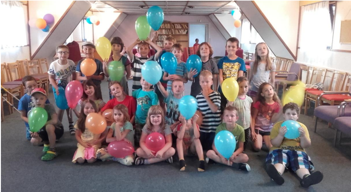
Žáci 2. ročníku v rekreačním zařízení Radost

Letošní školy v přírodě se zúčastnilo celkem 10 tříd I. stupně. Žáci 2. A strávili červnový týden v rekreačním zařízení Radost nedaleko Blatné. Navštívili kozí farmu, zámek v Blatné i westernové městečko Fort Hary. Třídy 3. A a 3. B navštívily Zelenou Lhotu na Šumavě, kde se žáci proměnili v hledače pokladu. 4. A vyjela na Modravu, děti podnikaly výpravy podél řeky Vydry a navštívily geopark na Rokytě s nádhernými leštěnými kameny. Žáci 5. ročníku, 1. A a 4. C strávili pět dnů v Kubově Huti, 1. B a 4. B na Horské Kvildě. Učitelé připravili pro děti velmi pestré programy, při nichž žáci nenásilnou formou poznávali přírodu, stmelovali třídní kolektiv, utužovali fyzickou zdatnost a vytrvalost.